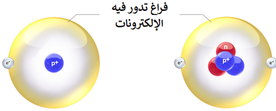
ذرة الهيدروجين minha.ji.net