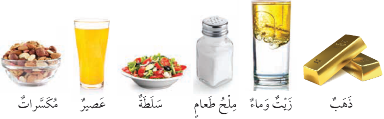
مُكسَّراتٌ عَصِيرٌ سَلَطَةٌ مِلْحُ طَعَامٍ زَيْتٌ وَمَاءٌ ذَهَبٌ