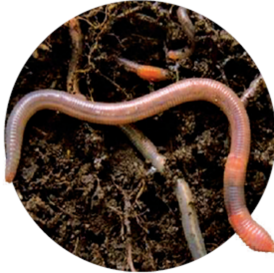
دودة الأرض من الديدان الحلقية.