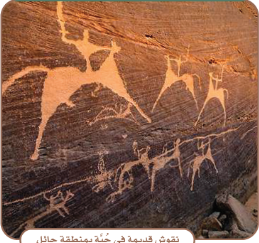
نقوش قديمة في جُبة بمنطقة حائل

كان الناس يكتبون ويرسمون أحداثهم التاريخية على: