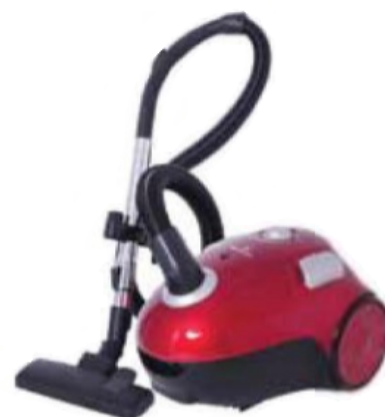
كنس السجاد بصورة آلية