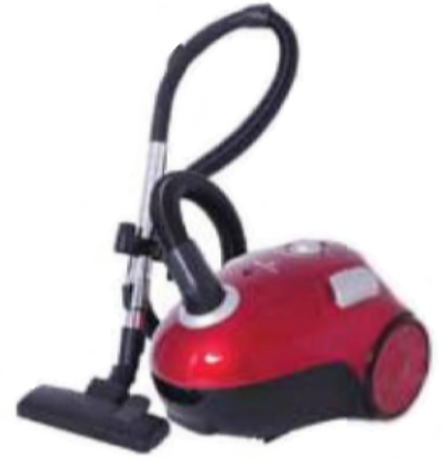
كنس السجاد بصورة آلية