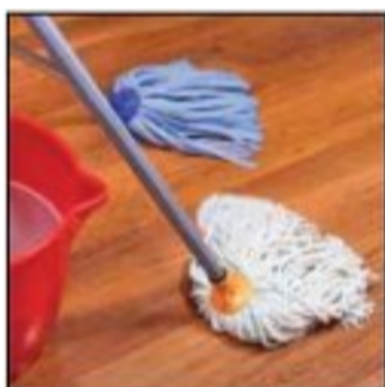
مسح الماء عن الأرضيات