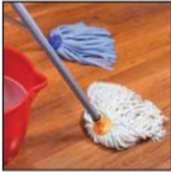
مسح الماء عن الأرضيات