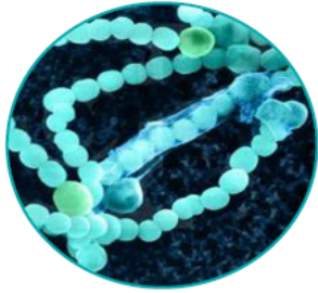
بكتيريا خضراء مُزرقَّة

• أتاامل الصور الآتية لبعض خلايا البكتيريا كما تظهر تحت المجهر الإلكتروني.