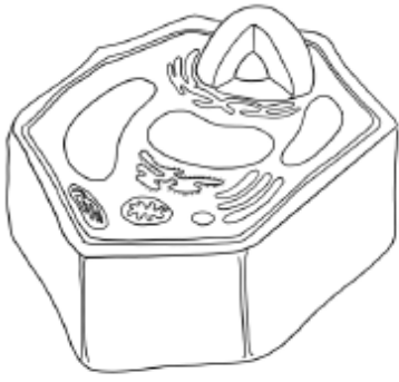
الخلية التي رسمتها منى