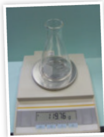
قراءة الميزان = ١١٩,٧٦ جرام