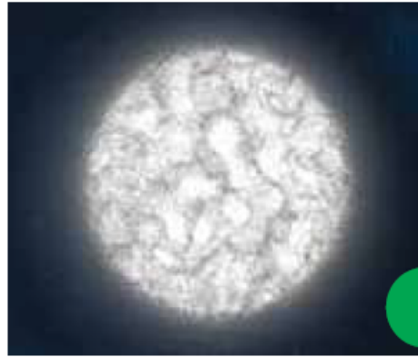
ب: قزمٌ أسودٌ.