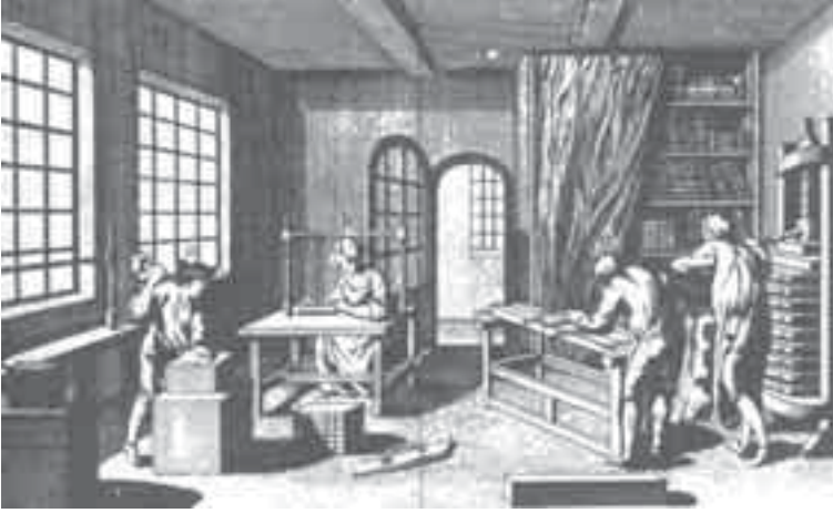
ورشة لتجليد الكتب، من كتاب: Encyclopedie, ou dictionnaire raisonne [...] 3. izd. Livourne 1776.

الحكام وهواة جمع الكتب الذين كانوا يجمعون الكتب لإبراز مكانتهم أمام الضيوف في الدرجة الأولى. وفي الواقع لم يشأ مكسيمليان ولم يستطع أن يفهم، كغيره من الحكام في ألمانيا وغيرها من البلدان، كما كان قد فهمه الكاردينال بساريون من أن الكتاب هو في الدرجة الأولى مصدر للمعلومات العلمية والغايات الفنية وفي الدرجة الثانية هدف للاستعراض.