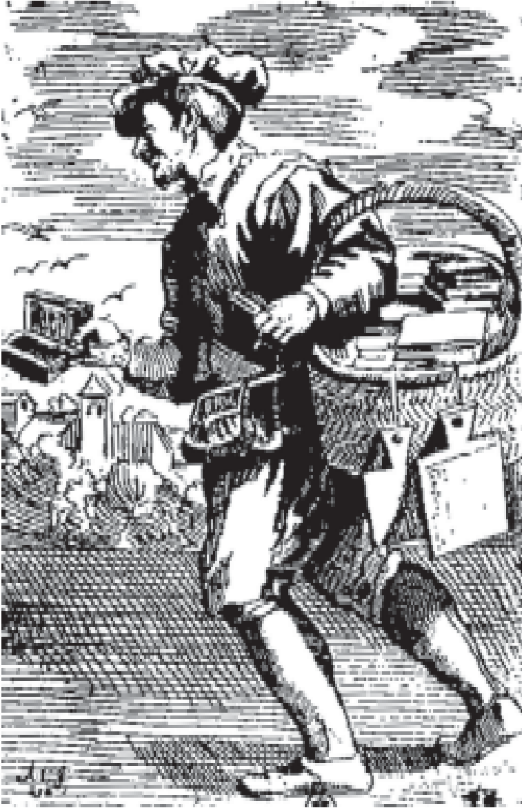
البائع المتجول للكتب-حفر على النحاس للفنان س. غولييان من سنة 1646م.