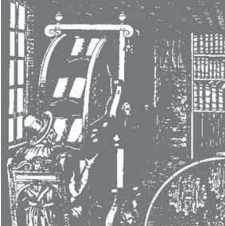
آلة القراءة على شكل دولاب تخيلها ووصفها الإيطالي أوغستينو رامبلي في كتابه المطبوع في باريس سنة 1588م Le diverse at artificiose machine. Pariz 1588

هذا عمل والده وطبع لاحقا «الأطلس العام». في أحد عشر مجلدا خلال سنة (1650-1662م). وقد كان هذا الأطلس أفضل عمل من نوعه طبع حتى ذلك الحين، بل أنه لم يتم تجاوزه في بعض الجوانب حتى هذا اليوم. وقد طبع هذا الأطلس لاحقا في الألمانية والفرنسية والإسبانية. وفي الواقع لم يكن من المصادفة أن يصدر في هولندا عمل ضخّم من هذا النوع، فقد كانت هولندا في ذلك الوقت في ذروة قوتها البحرية وكانت سفنها تجوب في كل بحار العالم وتجلب معها المعطيات عن المناطق الجديدة وعن السكان الذين يعيشون فيها. ولذلك فإنه ليس غريبا أنه في هذا البلد بالذات كانت تعمل أسرة بلو التي أصدرت أفضل الخرائط الجغرافية ومجسمات الكرة الأرضية والأطالس.