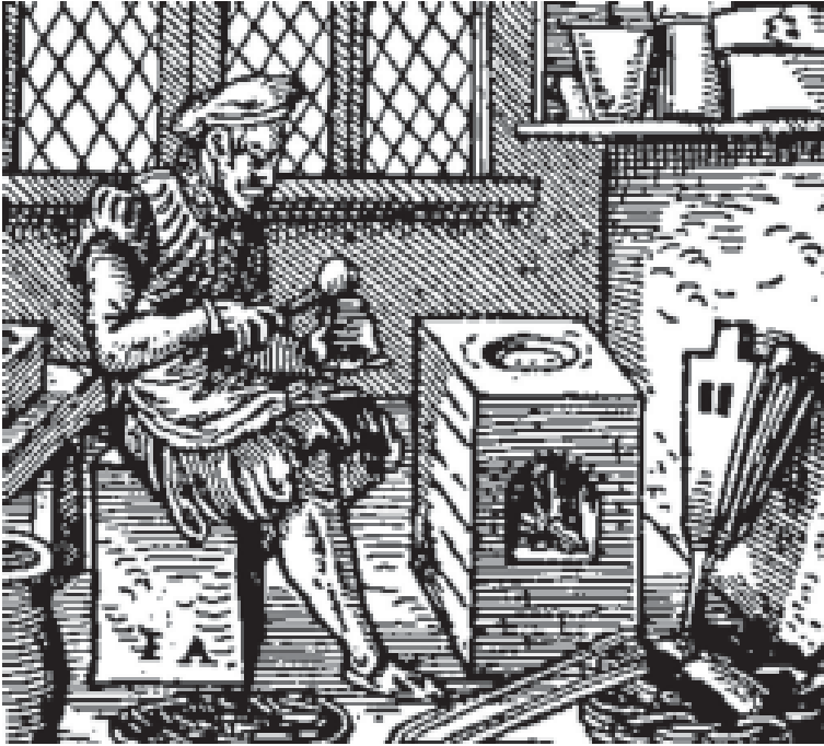
سباك الحروف من كتاب: Jost Amman, Standebuch 1568

وأجود سباكي الحروف وأشهر الفنانين لتزيين الكتب بالرسوم. وقد كسب بلاتيني الشهرة بإصداره الفخم للتوراة في عدة لغات والتي صدرت في