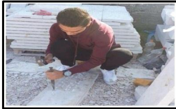
دقاقة أو نقش الحجر