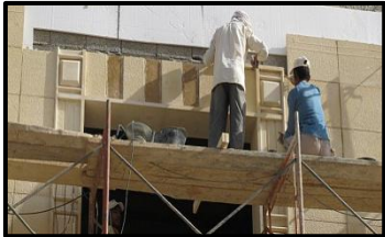
عملية البناء بالحجر

السؤال الرابع: وضح خطوات البناء بالحجر الطبيعي: