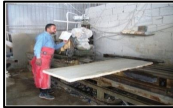
قص وتجهيز الحجر بالمناشير