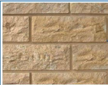
نمط البناء بالمداмик منتظمة الارتفاع