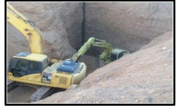
استخراج الصخور الطبيعية