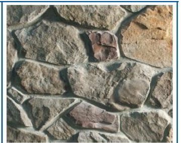
نمط البناء بدون مداميك والأحجار غير مقصوصة

السؤال الخامس: ضع علامة ( ✓ ) أمام العبارة الصحيحة و إشارة ( ✗ ) أمام العبارة الخاطئة فيما يلي: