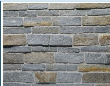
نمط البناء بالمداмик غير منتظمة الارتفاع