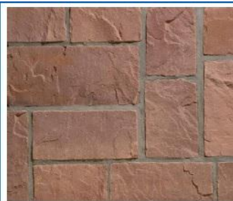
نمط البناء بدون مداميك والأحجار مقصوصة