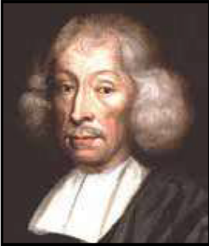
جون راي (1627 - 1705 م)

صنّف النباتات إلى مجموعات بناءً على أوجه التشابه والاختلاف بينها، وهو أول من أشار إلى مفهوم النوع Species .