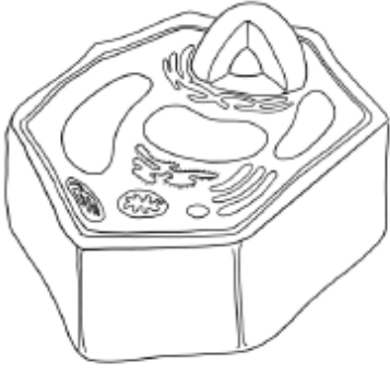
الخلية التي رسمتها منى