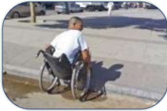
مساعدة الرجل، برفع كرسيه وإيصاله إلى المكان الذي يرغب في الذهاب إليه.

(3) تظهر في الصور الآتية مواقف نراها في حياتنا اليومية، أقترح التصرف الأنسب من وجهة نظري إذا واجهت موقفًا منها: