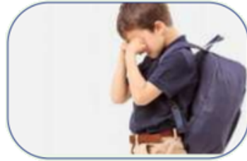
سؤال الطفل عن سبب حزنه ومحاولة مساعدته.