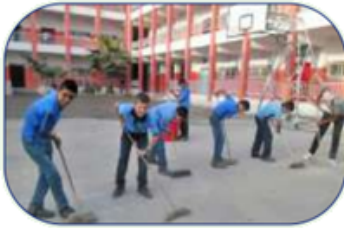
مشاركتهم أعمال التنظيف.