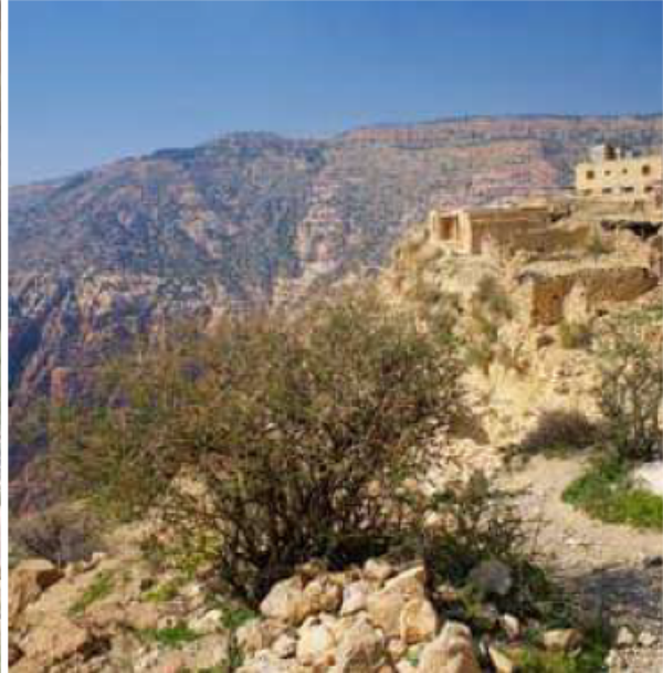
▲ محميّة ضانا.