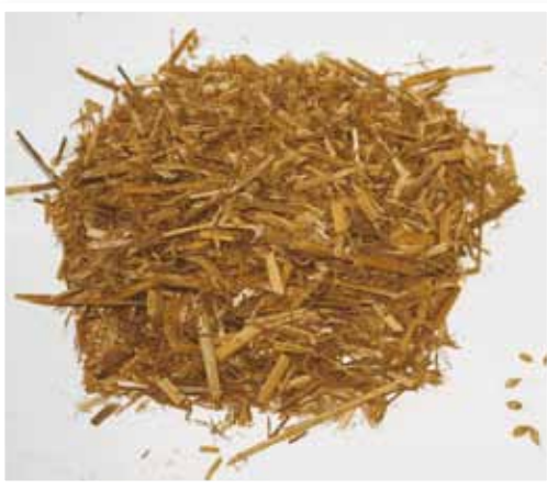
الشكل (٢-٣): تبين قمح.

الأتبان: تعدّ الأتبان من أفقر مواد العلف في العناصر الغذائية، حيث تحتوي على نسبة مرتفعة من الألياف الخام تصل إلى ٣٠ - ٤٠ ٪، ونسبة ضئيلة من البروتين الخام والدهن والكالسيوم والفسفور. وهي قليلة الاستساغة عند الحيوانات، لها تأثير قابض في الجهاز الهضمي عند الحيوانات المجترّة، وقيمتها تنضح