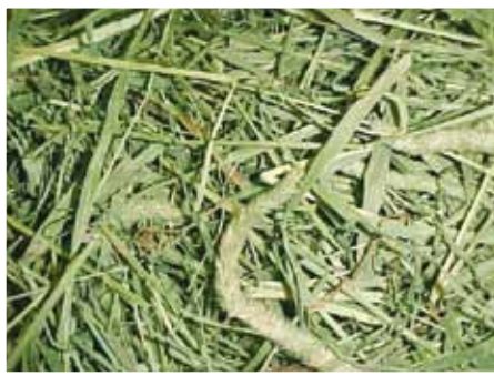
الشكل (٢-٢): دريس نجيليّ جيد النوعية.

ينتج الدريس من عدد كبير من المحاصيل كالبقوليات، النجيليات، النجيليات والبقوليات معاً، حشائش المراعي، ويعدّ دريس النباتات البقوليّة مثل دريس الفصة