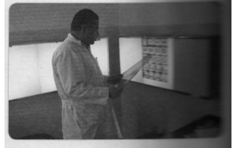
طبيب في مستشفى .