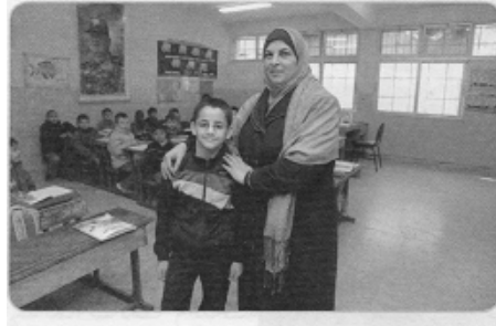
معلم في مدرسته .