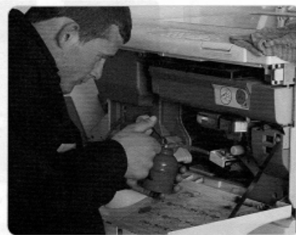
المواطن الصالح يؤدّي عمله بجد وإخلاص .