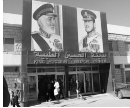
مدينة الحسين الطبية