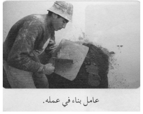
عامل بناء في عمله .