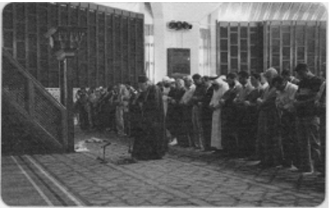
إمام مسجد في محرابه .