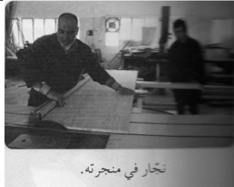
تجّار في منجرته .