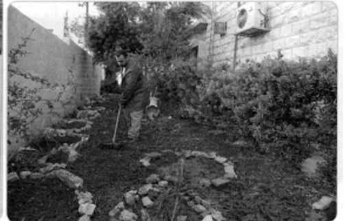
المواطن الصالح يحافظ على نظافة وطنه .