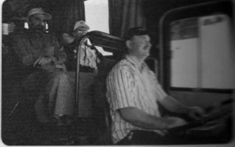
سائق في حافلته .

* جَمِيعُ هَؤُلَاءِ الْأَشْخَاصِ نَطْلُقُ عَلَيْهِمُ ( مُوَاطِنُونَ ) وَعَلَيْنَا أَنْ نَكُونَ صَالِحِينَ نَعِيشُ مَعًا بِحُبِّ وَأَمَانٍ