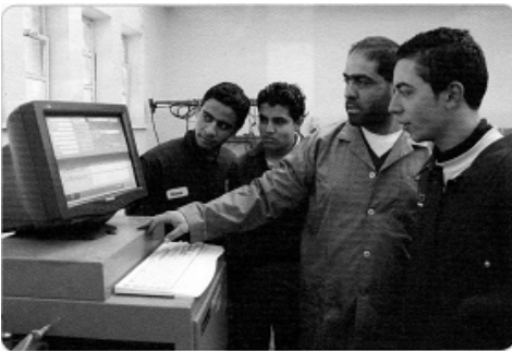
المواطن الصالح يتعلّم من أجل خدمة وطنه .